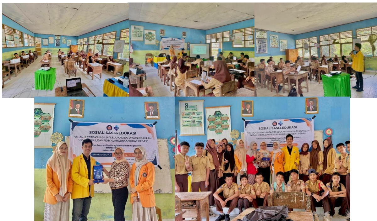
Gambar 2. Alur Pelaksanaan Kegiatan Edukasi